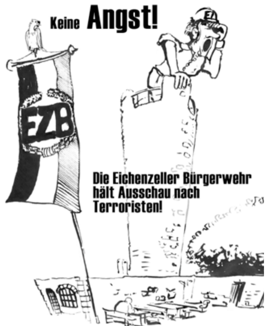
Karikatur: Alexander Sust

Doch die freiwillige Bürgerwehr hat schon weiterführende Pläne ausgearbeitet: „Wenn wir in unserer Landschaft wieder anfangen