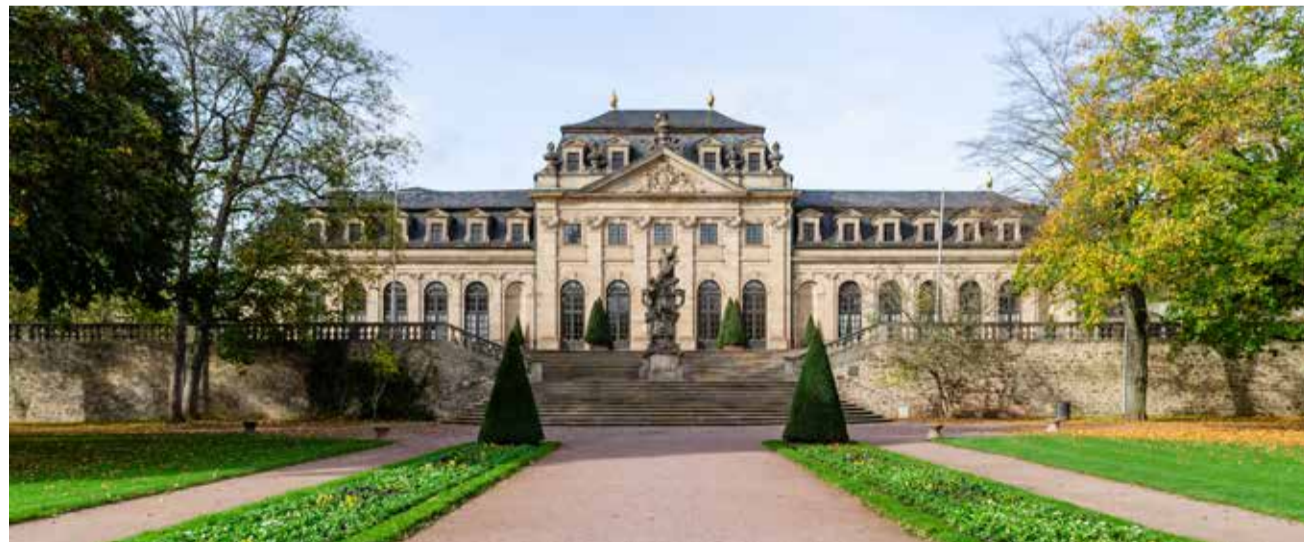
Ort eines denkwürdigen Geschehens: Der Bürgersaal in der Orangerie

alition in den Verwaltungsgang gebracht und kam letztlich zur Abstimmung. In einer denkwürdigen viereinhalb-Stunden Sitzung in der Orangerie, die corona-bedingt derzeit die Kulisse der Stadtverordnetenversammlung bildet, kam es zu einer inhaltlich hochwertigen und wirklich ausgewogenen Diskussion und Debatte. Dabei wurde über die Frage gestritten, ob es demokratisch vertretbar sei, einen gewähl-