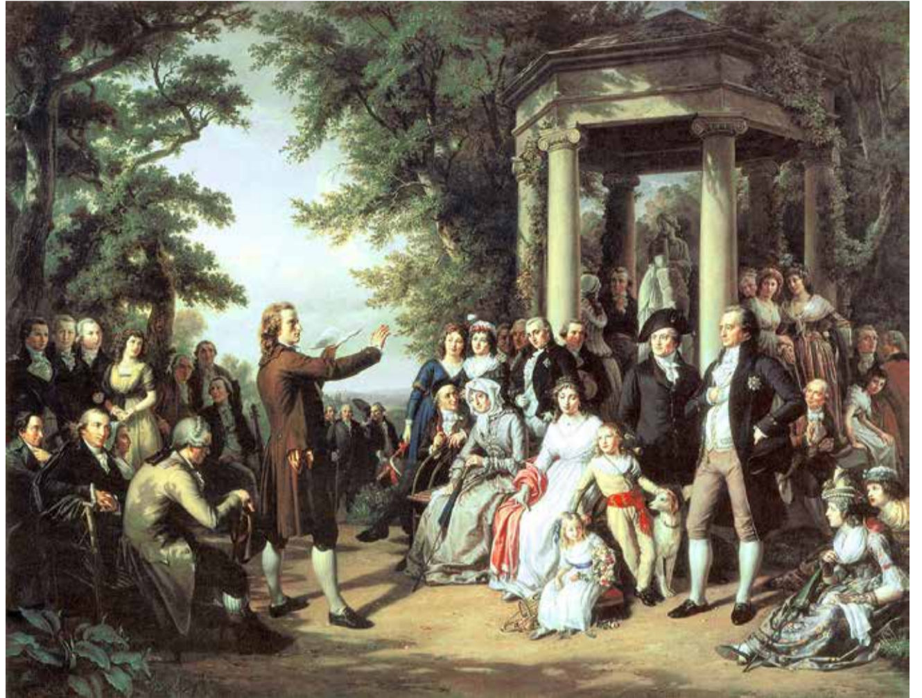
Der Weimarer Musenhof - Friedrich Schiller declamiert im Tiefurter Park. Unter den Zuhörern zweite Person ganz links (sitzend mit Blick zu Schiller) Herder, in der Bildmitte (sitzend mit Kappe) Wieland und rechts (stehend) Goethe (Ölgemälde von Theobald von Oer, 1860, heute als Leihgabe der Staatlichen Museen zu Berlin im Amtszimmer des Bundespräsidenten in Schloss Bellevue)

kerung auf 500 Millionen zu reduzieren, damit die Reichen die Welt für sich alleine haben. Das Geld dazu stamme von dem Juden Soros. Weiter würden 400.000 Kinder unterirdisch gefangen gehalten und gefoltert, um ihnen Adrenochrom als Verjüngungstrank für die reiche Elite abzuzapfen. Der alte (antisemitische) Aberglaube kommt im 21. Jahrhundert ins Monströse